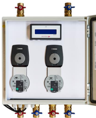
Expert typ GS

Wszystkie akcesoria posiadają odpowiednie badania i certyfikaty.